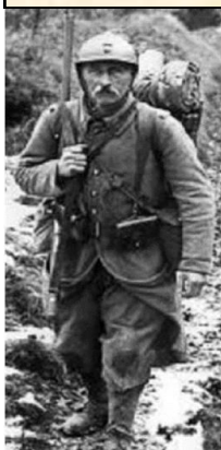
Exposition du 8 au 11 novembre 2018

Le pot de l'amitié sera offert à cette occasion