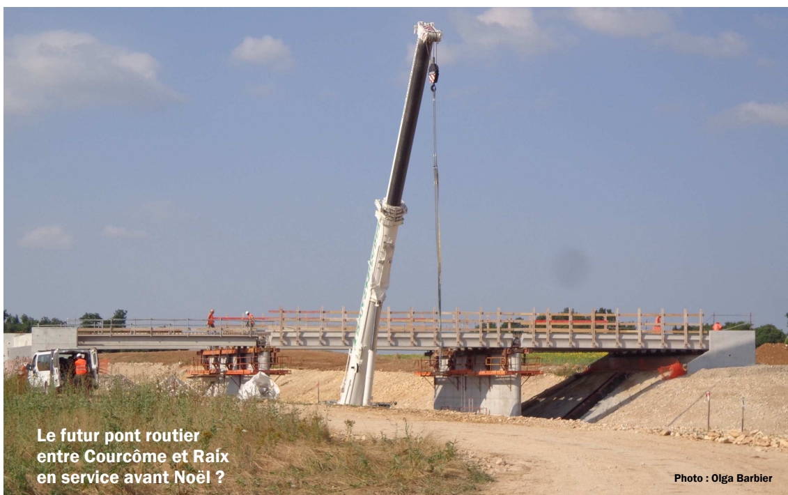
Le futur pont routier entre Courcôme et Raix en service avant Noël ?