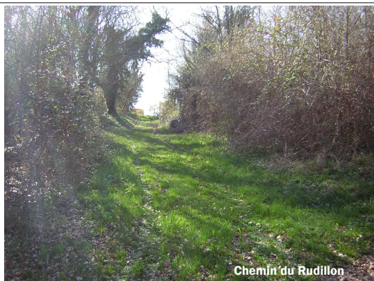
Chemin du Rudillon