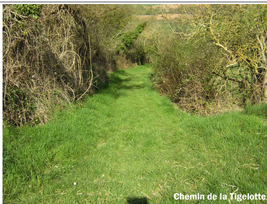
Chemin de la Tigelotte