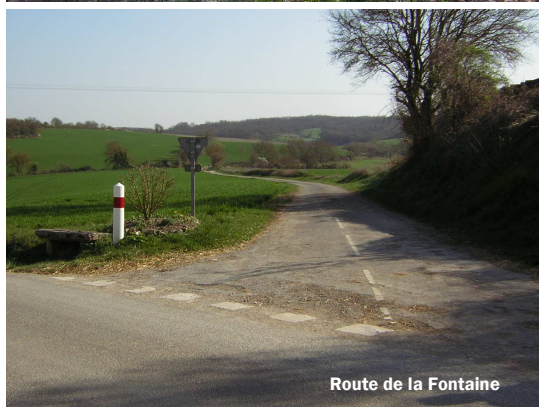
Route de la Fontaine