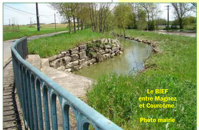
Le BIEF entre Magnez et Courcôme.