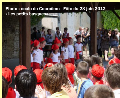
Photo : école de Courcôme - Fête du 23 juin 2012 « Les petits basques »

Quoi qu'il en soit, la confiance manifestée, lors de l'enquête, par une écrasante majorité qui trouvait tout à fait logique que la commune s'implique au besoin dans cette affaire, nous a fait chaud au cœur et le Conseil Municipal ne manquera évidemment pas de tenir compte de l'avis des habitants !