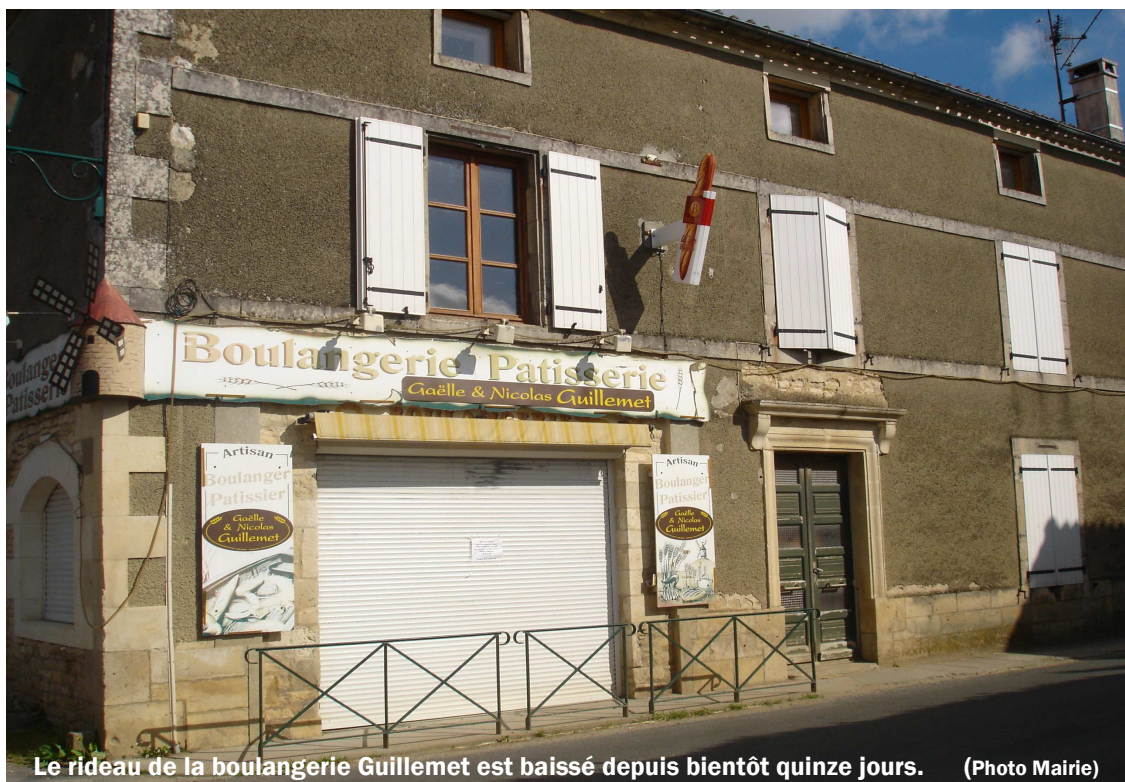
Le rideau de la boulangerie Guillemet est baissé depuis bientôt quinze jours.

Des charges trop lourdes, un outil de travail vétuste et des pannes à répétition, ont conduit nos boulangers à finalement jeter l'éponge après trois années de galère : ils ont déposé le bilan la semaine dernière.