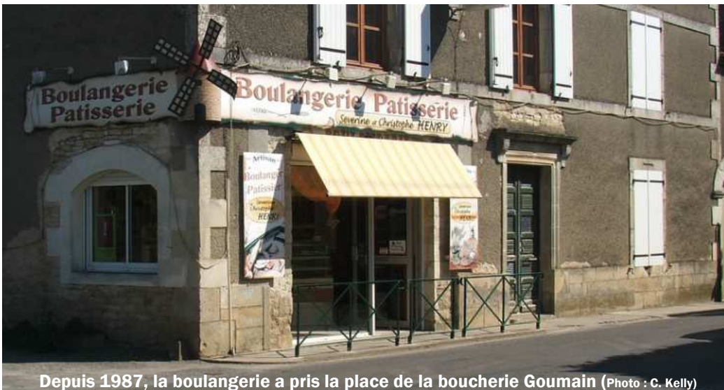
Depuis 1987, la boulangerie a pris la place de la boucherie Goumain

Après l'incendie de la boulangerie en février 1985, le conseil municipal de Courcôme a immédiatement mis en œuvre une stratégie destinée à faire en sorte que la commune retrouve au plus vite « son » commerce disparu !