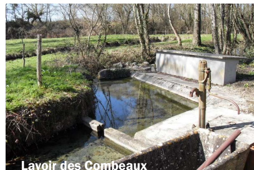
Lavoir des Combeaux

* 94% du volume prélevé est issu des nappes souterraines.