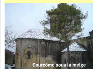
Courcôme sous la neige

17 décembre : 20h30 Salle socio-culturelle Théâtre « L'invité »