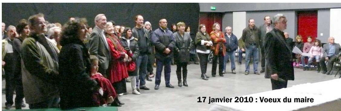
17 janvier 2010 : Voeux du maire

Vendredi 26 : 20 h 30 LOTO du collège Salle des fêtes VILLEFAGNAN