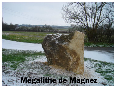
Mégalithe de Magnez