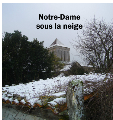
Notre-Dame sous la neige

Agence postale : Lundi, mardi, jeudi et vendredi de 9 h à 12 h 30 mercredi de 10 h 30 à 12 h 30.