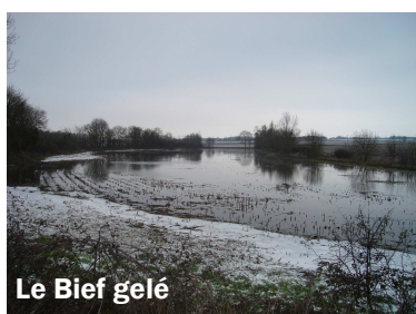
Le Bief gelé